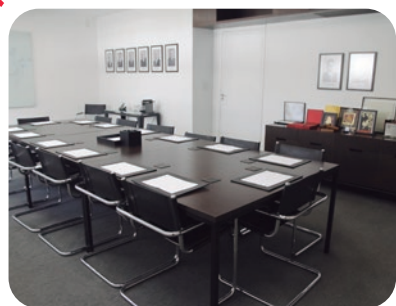
Sala da Diretoria Board room