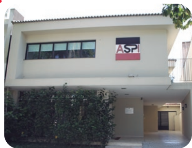
Sede ASPI ASPI headquarters