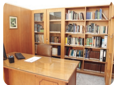
Biblioteca Sebastião Silveira Library