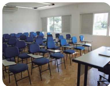
Sala de Estudos Studies room