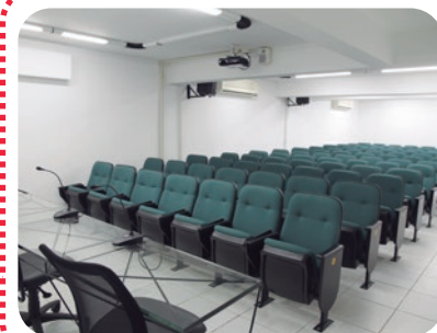
Auditório João da Gama Cerqueira João da Gama Cerqueira Auditorium